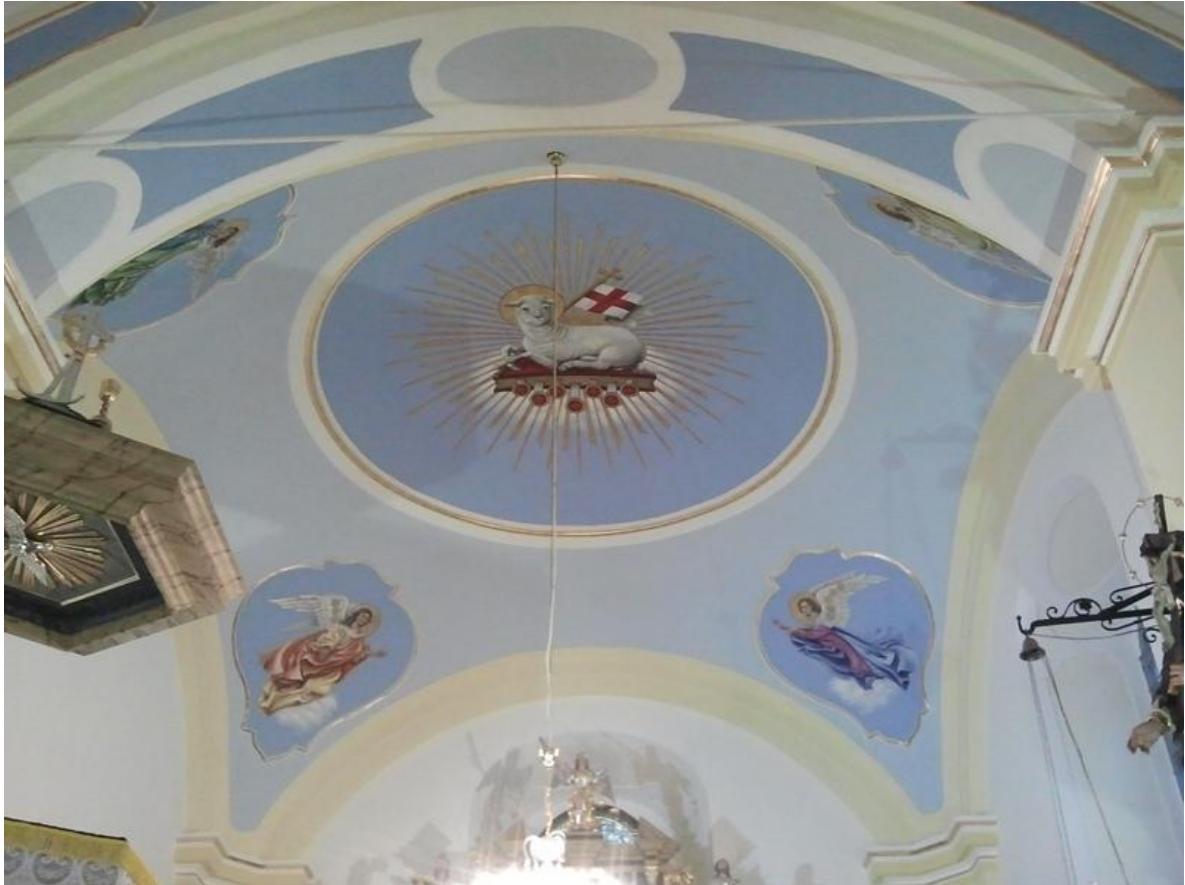
Renowacja wnętrza kościoła pw św. Katarzyny w Lipowej