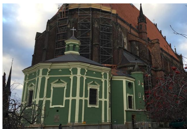
Remont elewacji Baptysterium przy kościele pw św. Jakuba w Nysie