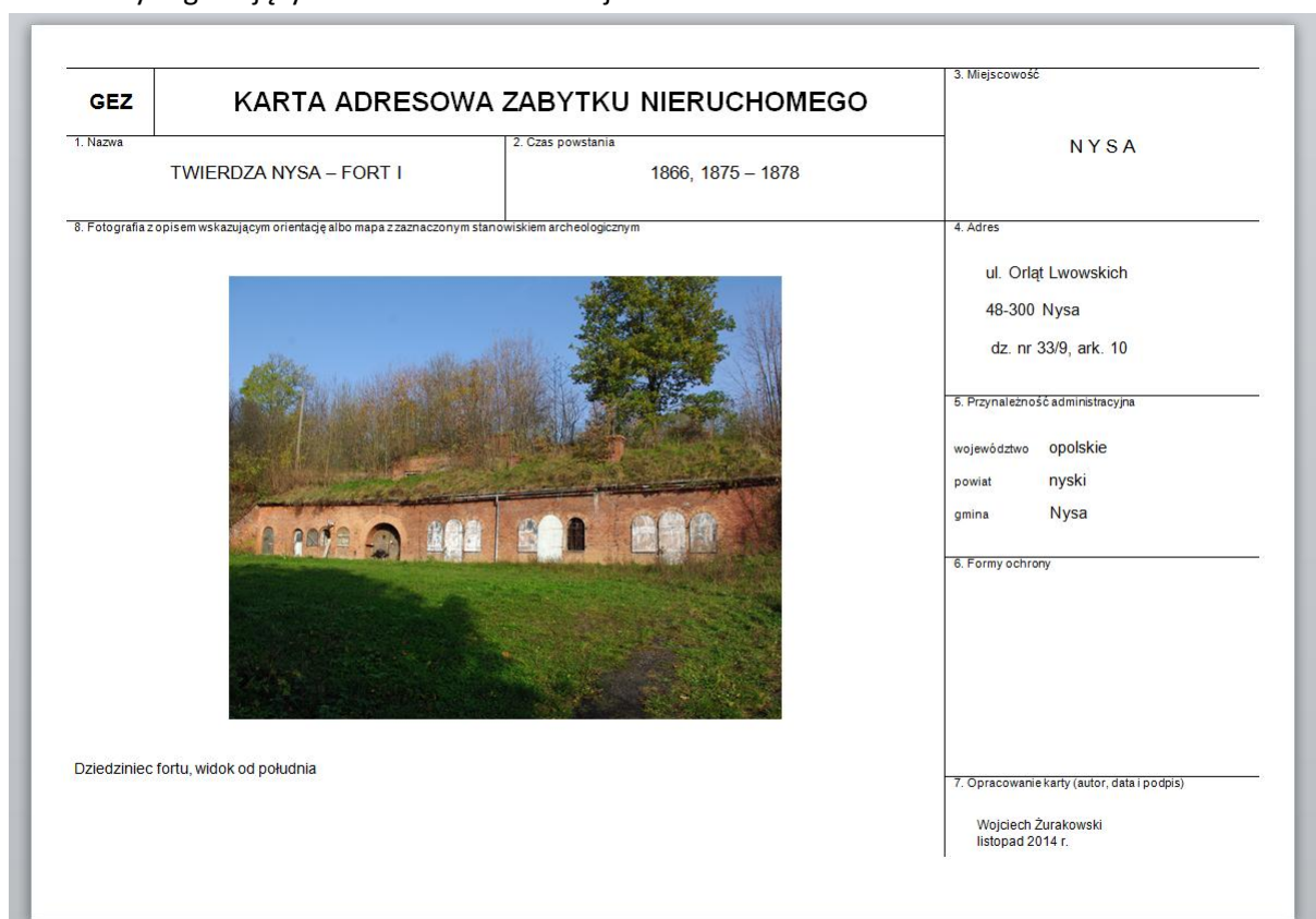
Przykładowa karta adresowa zabytku wpisanego do gminnej ewidencji

Podjęcie takiej decyzji umożliwiło rozbiórkę obiektu, która była konieczna z uwagi na zły stan techniczny zagrażający katastrofie budowlanej.