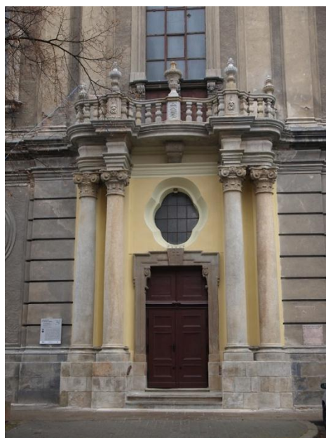
Remont portalu głównego kościoła pw św. Ap. Piotra i Pawła w Nysie