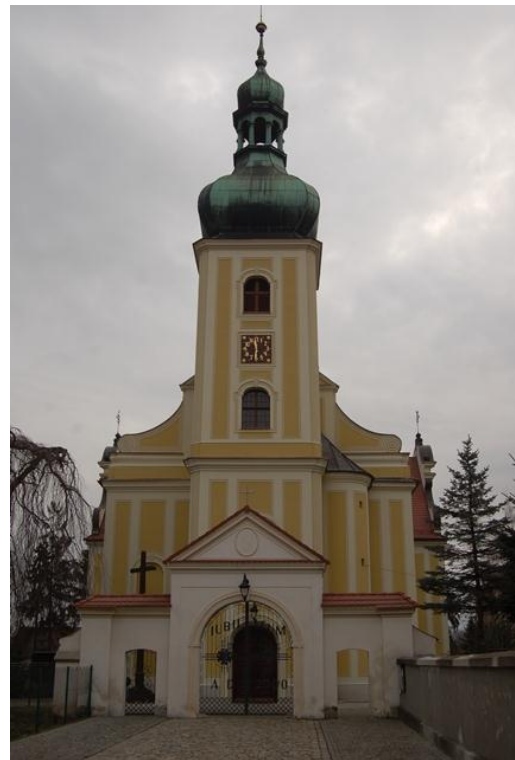
Remont elewacji frontowej kościoła i wieży kościelnej pw św. Jana Chrzciciela w Nysie